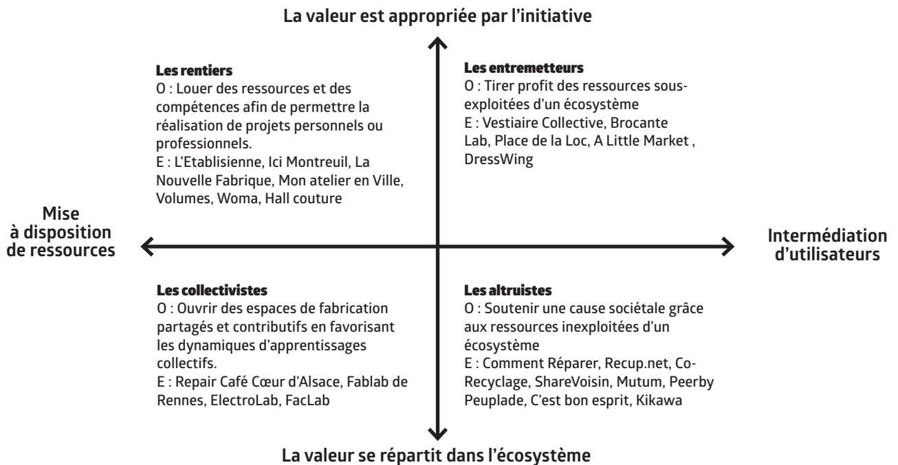
Figure 1 : L'économie collaborative : quatre types de business models (Acquier et al. 2016b)

Légende O : Objectifs ; E : Exemples analysés