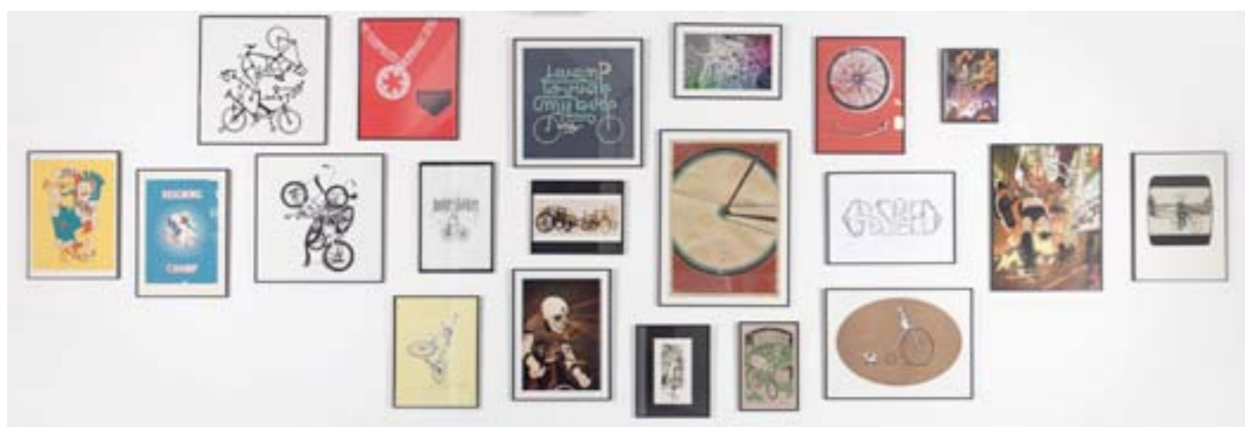
Collection fondation d'Art Oxyane / association Kraft