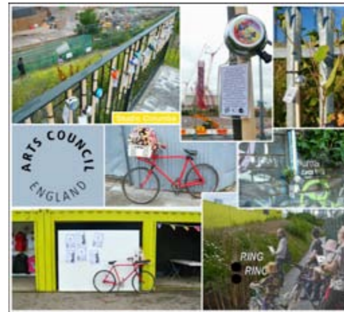
PRIEST (Uk) – Bow Bell Ring Installation sonore participative

Le Manège à vélo pour enfants à déjà été programmé par Kraft, avec grand succès !