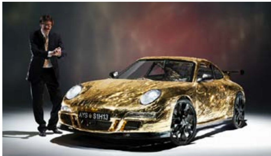
Ifek (Autriche), Porsche à pédales Oeuvre jamais présentée faute de disponibilité sur la période de velodream. Kraft a toutefois eu de bons contacts avec l'artiste