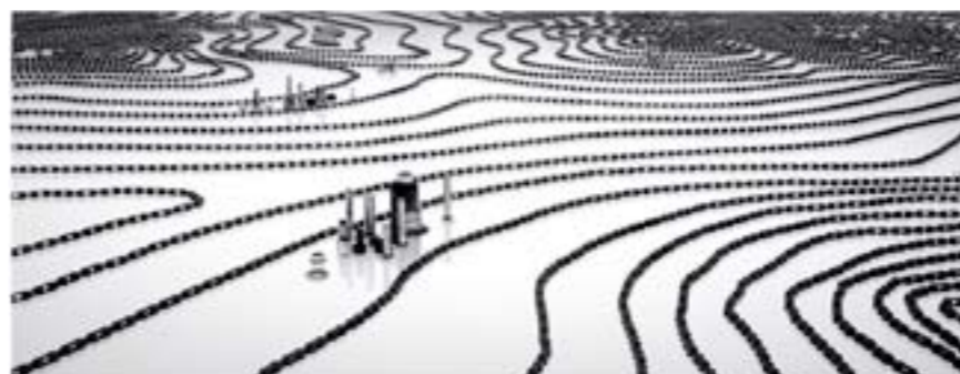
Thomas Yang, Cityscape, 2012, 84 x 33,5 cm