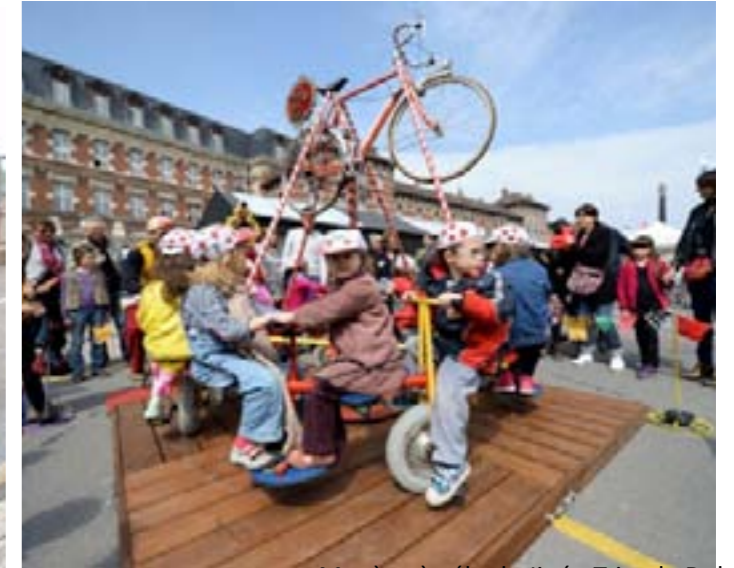
Manège à vélo de Jipé - Tricycle Dol