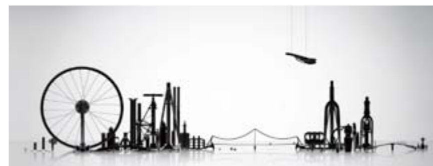
Thomas Yang, Terrain, 2012, 84 x 33,5 cm

sérigraphies, lithographies et photographies. Collection fondation d'Art Oxyane / association Kraft.