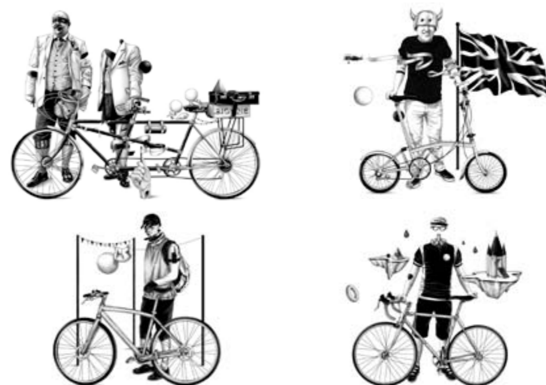
Ugo Gattoni, London Portraits, 2013. Reproductions en 1 m x 1,20 m Collection fondation d'Art Oxylane / association Kraft.