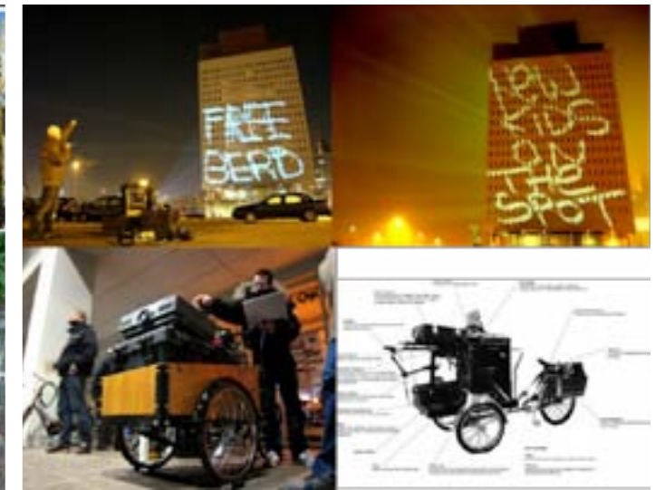
GRAFFITI RESEARCH LAB (D) - L.A.S.E.R Tag Un procédé permettant de tagger des bâtiments uniquement avec de la lumière. Il est rattaché à la fondation Eyebeam Openlab, qui développe des outils destinés à "appuyer technologiquement les individus pour modifier et réinvestir de manière créative leurs environnements envahis par la culture du commerce et de l'entreprise". Ces artistes transposent ainsi l'esprit "open source" dans le monde des arts urbains.

Le Manège à vélo pour enfants à déjà été programmé par Kraft, avec grand succès !