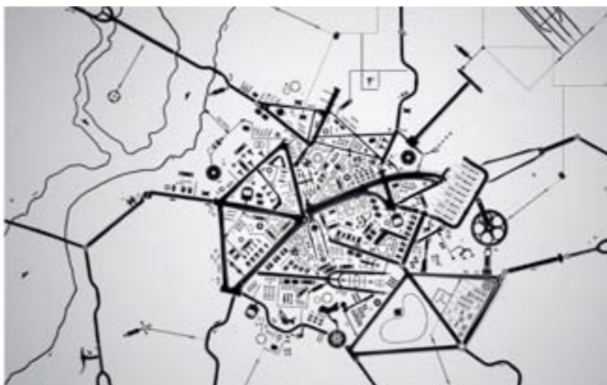
Thomas Yang, Road Map, 2012, 84 x 53 cm

Dans l'esprit de la promotion du cyclisme urbain dans le monde entier, les lithographies de Thomas Yang vous proposent de ralentir et de regarder autrement la ville et le vélo. Ses compositions (produite par impression de pneus ou de photographies de montages réalisés à partir d'éléments de vélo) encouragent à se libérer de leur routine quotidienne, et à regarder leur environnement dans une lumière complètement différente