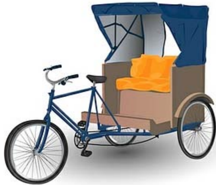
Teranga Vélo Calèche : M. Nusbaum vous emmène à bord de son vélo taxi à travers Marseille. (disponible à la location)