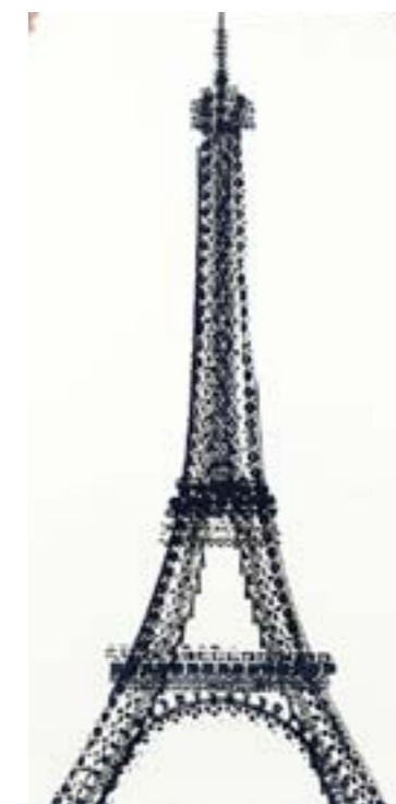
Thomas Yang, Tyre Tracks série (New York, Paris, London et Beijing) : The Cyclist's Empire & Bicycle Mon Amour 84 cm X 42 cm

Dans l'esprit de la promotion du cyclisme urbain dans le monde entier, les lithographies de Thomas Yang vous proposent de ralentir et de regarder autrement la ville et le vélo. Ses compositions (produite par impression de pneus ou de photographies de montages réalisés à partir d'éléments de vélo) encouragent à se libérer de leur routine quotidienne, et à regarder leur environnement dans une lumière complètement différente