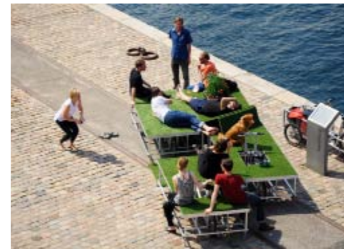
parkcycle swarm is a mobile green space by rebar group + N55 (Copenhagen)