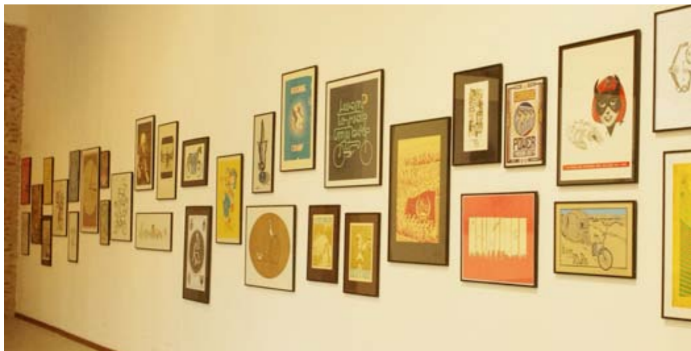
40 posters venus des USA, Italie, Belgique, France, Japon, Chine, UK.