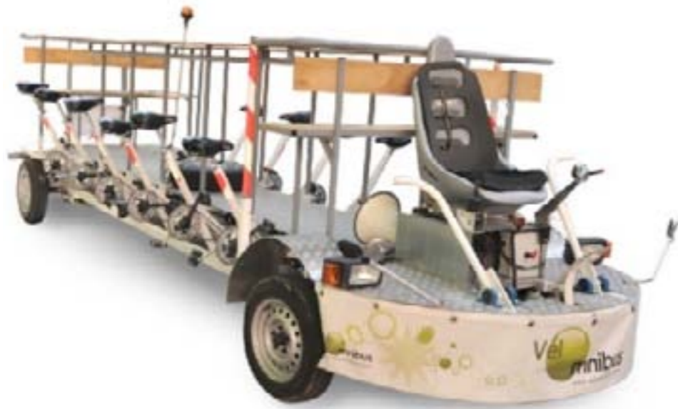
velomnibus 12 pédaleurs - 8 passagers - 1 pilote (disponible à la location)