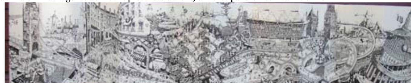
Ugo Gattoni, Bicycle, 2012. Collection fondation d'Art Oxylane / association Kraft.

L'œuvre «Bicycle» (2012) est actuellement présentée en petit format dans l'exposition «J'aime les panoramas» au MuCEM de Ugo Gattoni sont présentée dans « J'aime les panoramas » au MuCEM.