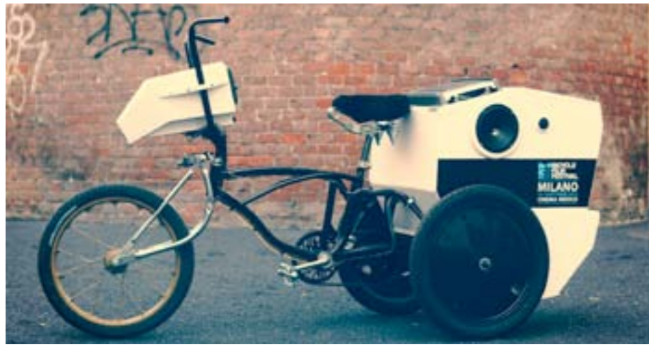
Luca BATTISTON (Italie), Godziella (collection fondation d'art Oxylane/ association Kraft) : pour interpeller les passants en musique, avant de mettre l'ambiance musicale.